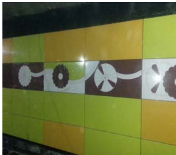
Panouri serigrafiate executate la nivelul căii de rulare