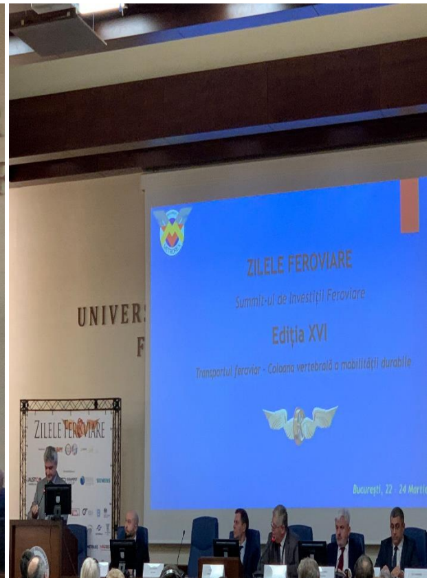
Evenimentul a fost promovat pe paginile de facebook și instagram ale Metrorex și preluate în presă.