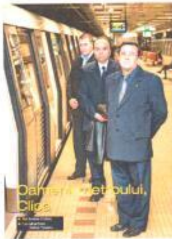
Proiectul Oamenii Metroului - Bucuresti si Cluj

Proiectul Oamenii Metroului este un proiect special conceput pentru a celebra oamenii ce au făcut posibilă existența și funcționarea metroului românesc de-a lungul timpului, dar și având în vedere că anul acesta metroul sărbătorește 35 de ani de existență. Pentru a marca evenimentul vor fi organizate o serie de manifestări (expoziții de fotografie, articole în presă, simpozioane, Ziua Porților Deschise la Metrou, ș.a.). Proiectul Oamenii Metroului a început la sfârșitul anului 2013 cu promovarea în media a trei mecanici de metrou meritoși - Oameni ai metroului - prin emisiuni de televiziune, radio și articole în presa scrisă și va continua pe parcursul anului 2014.